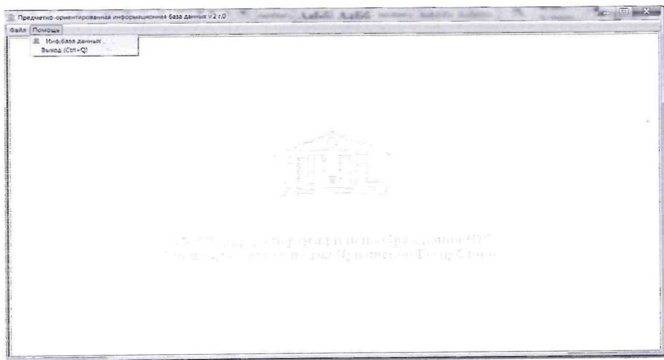
Рис.4 Верхнее меню выход из программы

Весь исходный код программного обеспечения хранится на сервере АУ Чувашской Республики "Центра экспертизы и ценообразования в строительстве Чувашской Республики" Минстроя Чувашии.